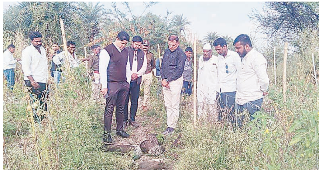
ब्रह्मास्त्र ►► इंदौर

बिलावली के पास स्थित दुगापुर में एक खेत पर आठ राष्ट्रीय पक्षी मोर मृत अवस्था में मिले। सूचना मिलते ही वन विभाग व डाक्टरों की टीम मौके पर पहुंचे। जानकारी के मुताबिक पांच मादा, तीन बच्चे खेत पर मृत अवस्था में मिले हैं, जिन्हें पोस्टमार्टम के लिए भेजा गया है।